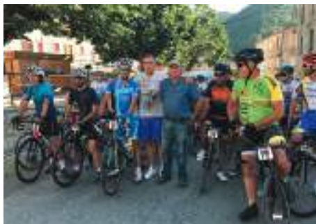
Limitée à 250 participants, l'épreuve est en passe de devenir le rendez-vous vélo de référence en Corse.